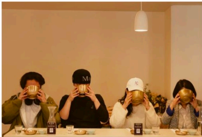
Le restaurant Okdongsik ne propose qu'un seul plat: le dweji gontang , soupe coréenne populaire qui

relle nationale, appelée hallyu . Une recette diplomatique bien huilée avec des plats mis en scène dans les K-drama, les séries coréennes, comme le kimbab , le bibimbap ou le barbecue, et un soutien du gouvernement à l'implantation de restaurants à l'étranger. Résultat: en vingt ans, Paris est passé de 40 à plus de 250 établissements, selon le dernier recensement du ministère de l'Agriculture sud-coréen. En 2025, la Corée du Sud a aussi battu son record d'exportations agroalimentaires, pour un montant de près de 14 milliards